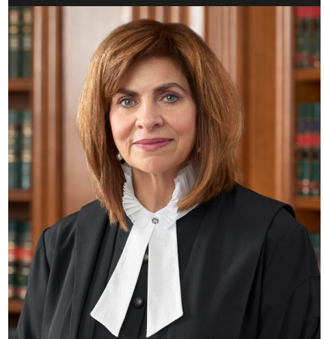
L'honorable Andromache Karakatsanis Juge à la Cour suprême du Canada